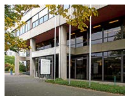
Hebelstrasse 20, Eingang ZLF

Bei dieser Gelegenheit möchten wir uns Euch, den Mitgliedern, gerne persönlich vorstellen, Eure Anliegen zur Kenntnis nehmen und Fragen beantworten. Die DOZUBA hat zur Aufgabe, die Bedürfnisse und Interessen der Gruppierung II innerhalb der Universität zu vertreten. Dazu ist es wichtig, mit den Mitgliedern engen Kontakt zu pflegen, damit wir diesem Anspruch gerecht werden können. Vor allem werden es Anliegen sein, die von genereller Bedeutung sein werden, wie zum Beispiel die Verankerung der DOZUBA im Statut der Universität. Aber wir sind uns auch bewusst, dass grosse Unterschiede in den Bedürfnissen von Gruppierung II Mitgliedern zwischen den Fakultäten bestehen. Deshalb ist die DOZUBA in steter Verbindung mit den Koordinatoren, Regenzmitgliedern und Fakultätsausschussvertretern und stimmt ihre Aktivitäten mit denselben ab.